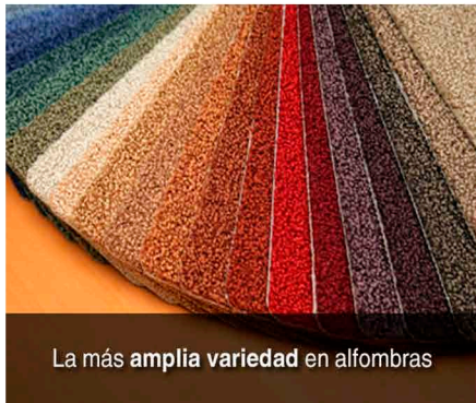
La más amplia variedad en alfombras

Resistencia a la abrasión: Es para saber cuanto se desgastan por el roce. Antiestática: por culpa de la fricción se suele generar electricidad estática en las alfombras, tenemos que tener en cuenta que tengan el proceso para que no se generen esas molestas descargas. Auto extinción: Que tengan este proceso para no propagar fuego.